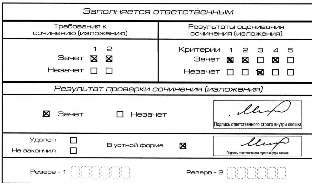
Рис. 11. Область для оценки работы сочинения (изложения) в устной форме

После окончания заполнения бланка регистрации ответственное лицо ставит свою подпись в специально отведенном для этого поле.